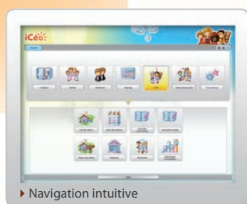
► Navigation intuitive