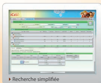
► Recherche simplifiée