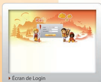
► Écran de Login