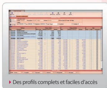
► Des profils complets et faciles d'accès