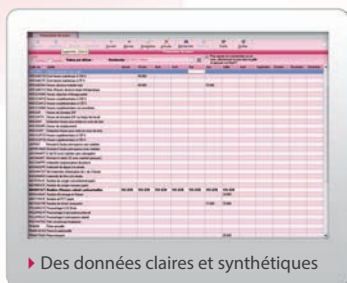
► Des données claires et synthétiques

Catégorie, mode de financement envisagé, type de dispositif, organisme de formation, liste des salariés concernés, durée et coût des formations... Retrouvez toutes les informations dont vous avez besoin pour établir votre budget prévisionnel, éditer la liste des demandes pour une éventuelle commission décisionnaire, engager des dépenses ou suivre vos dossiers de financement.