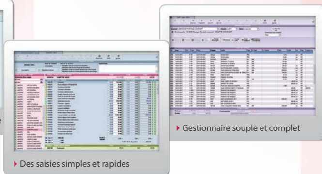
► Gestionnaire souple et complet